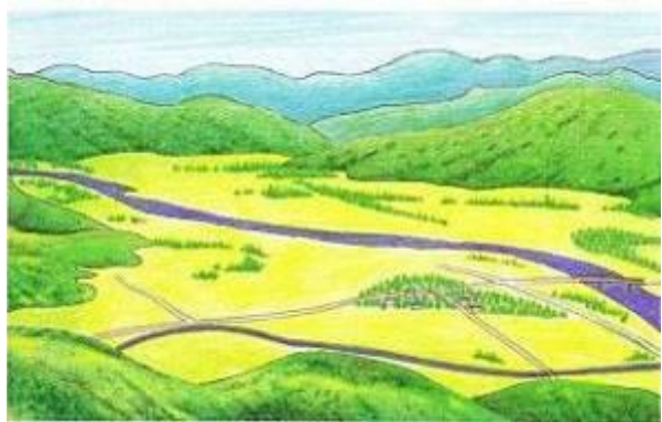
せきかわぼんち せきかわむら 関川盆地のようす(関川村)

ぼんち か がんだんきゅう み 盆地には河岸段丘がよく見られます。 か がんだんきゅう たい とち なが 河岸段丘とは, 平らだった土地が長い ねんげつ あいだ かわ なが 年月の間にくりかえし川の流れにけず られているうちに, 階段のような形にな ったところをいいます。