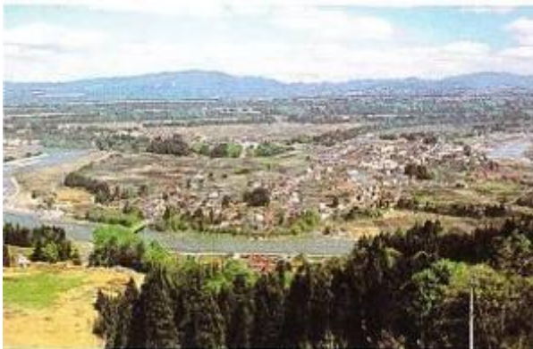
しなのがわ か がんだんきゅう つなんまち 信濃川の河岸段丘(津南町)

しなのがわ じょうりゅう つなんまち した 信濃川の上流の津南町では, 下の しゃしん から だん かがん 写真のような6~9段もあるみごとな河岸 だんきゅう み 段丘を見ることができます。