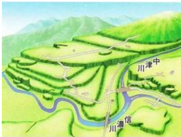
か がんだんきゅう つなんまち 河岸段丘のようす(津南町)